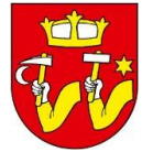
Príloha 1 Erb obce